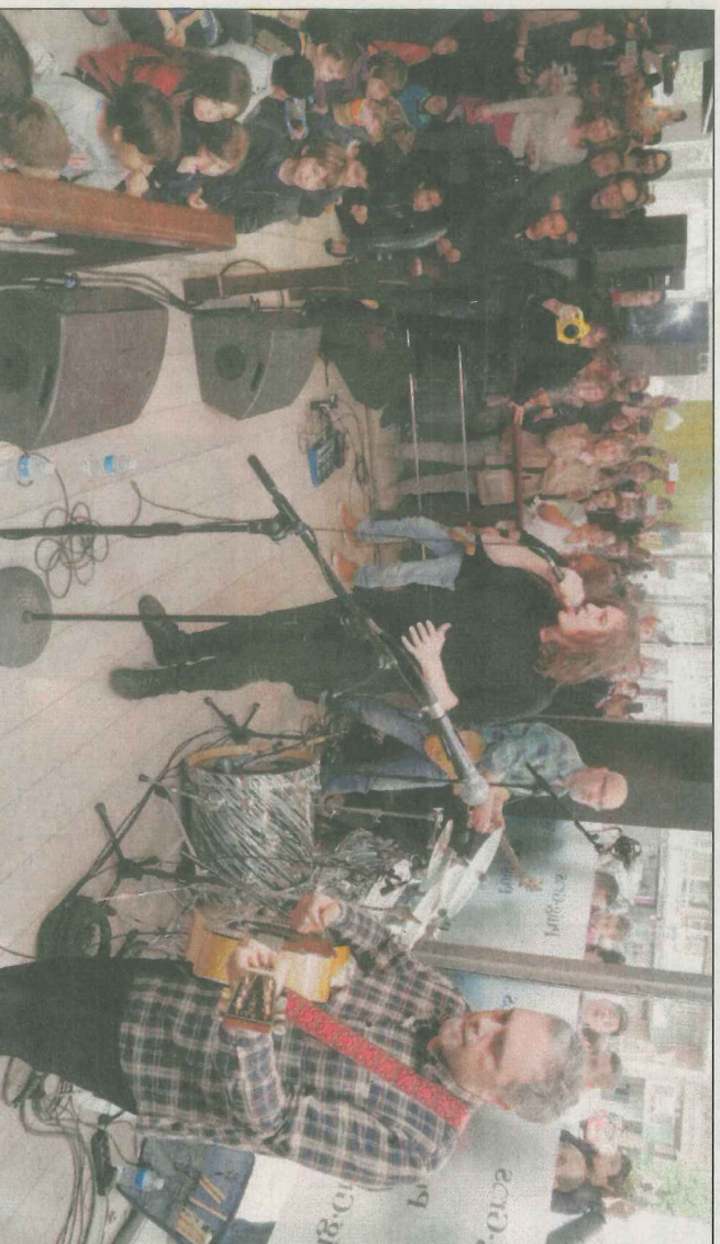
La banda de Girona sorprendió ayer a la ciudadanía con el bolo del Mercat de Cappon