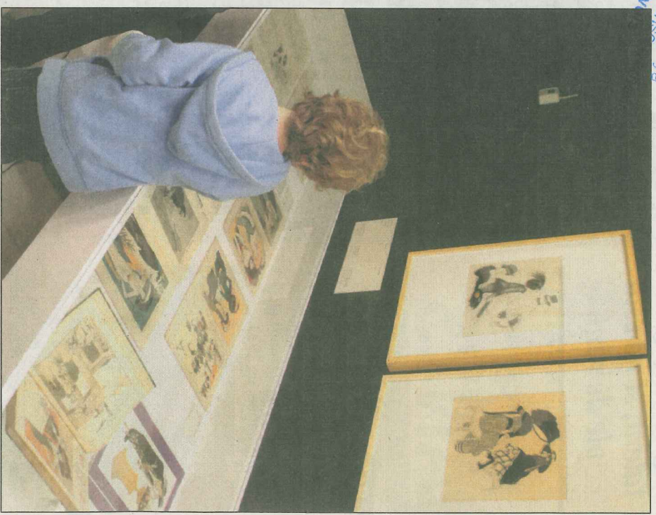
Las ilustraciones de Gosé son muy admiradas