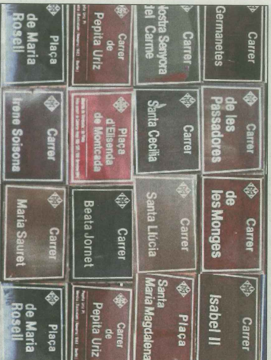
Imagen de la portada del estudio sobre las calles

Entidades de mujeres de Lleida se han movlizado para feminizar el callejero de la ciudad y hoy mismo van a presentar una moción al respecto en el pleno de la Paeria.